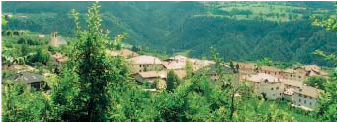
Arsio di Brez (TN)