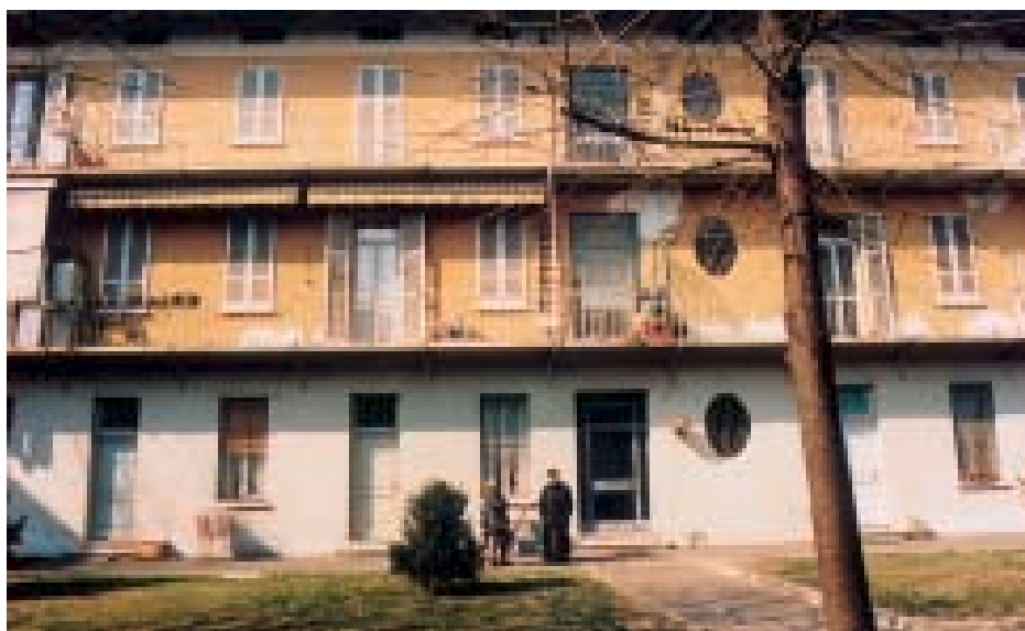
Sotto: il cortile interno della casa di fra Giacomo, confinante con la casa dei Montini