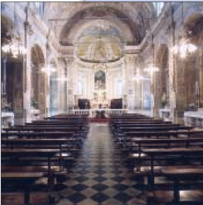
Chiesa parrocchiale di Corticelle (Bs)