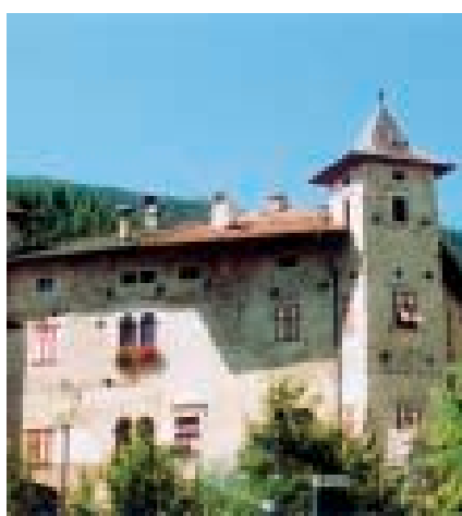
Castello di Arsio

11 luglio. Il Signore mi chiamò su un monte sul quale sorge un magnifico tempio. Entrai nella sua casa: Egli stava rinchiuso nel Santissimo Sacramento. Lo adorai di tutto cuore.