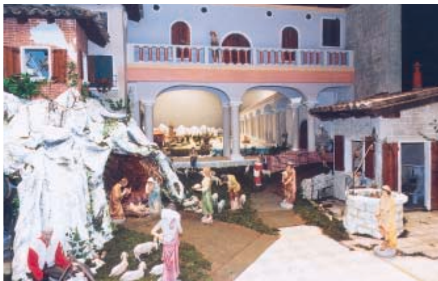
Presepio 2001-2002, nel Convento S. Francesco di Brescia