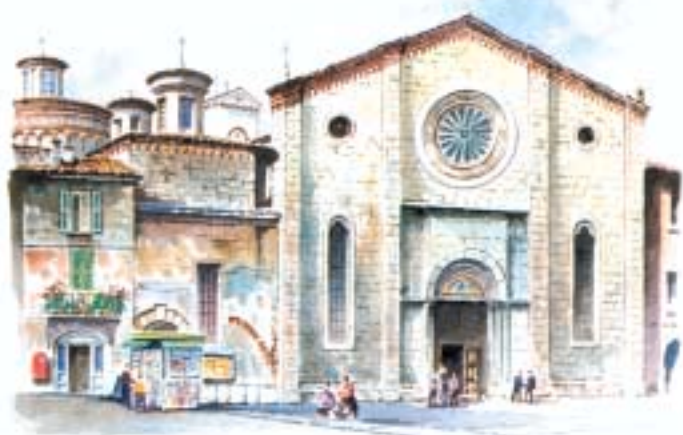
CHIESA SAN FRANCESCO - BRESCIA

Ringraziamo di cuore chi ci aiuta nella promozione della causa di beatificazione del Servo di Dio.