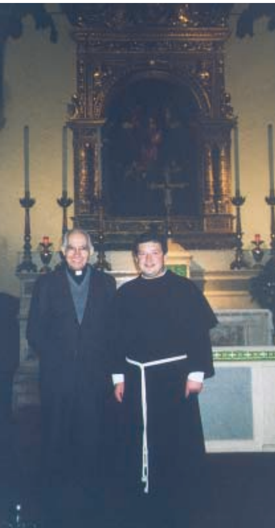
Visita del vescovo di Quito (Equador) mons. J. Dutari